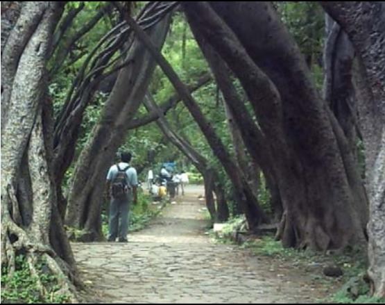
वृक्षगणना माहिती संकलण