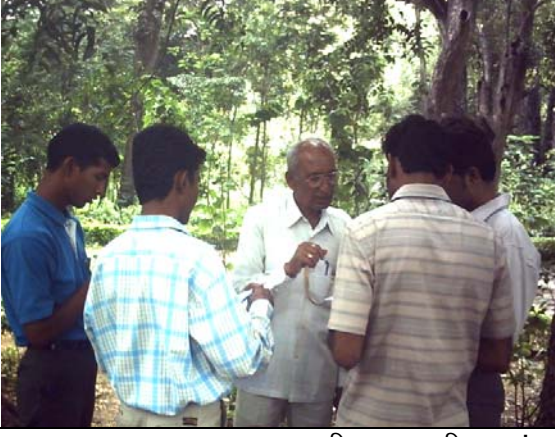
अनुभवी वनस्पती तज्ञांकडून मार्गदर्शन व प्रशिक्षण