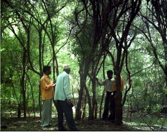
वृक्षगणना माहिती संकलण